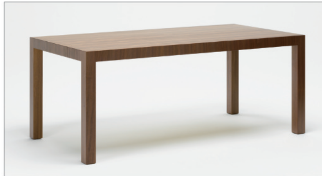
ブラックウォールナット